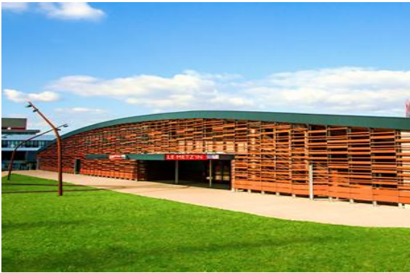
A 100 m de l'UFR MIM - 6 rue Augustin Fresnel